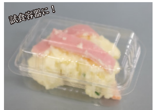
商品名：ユニコン LS- 小判 201