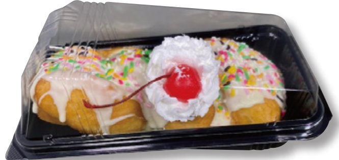
フードパック容器 1本用 〈ユニコンHD-176:B〉

商品名：ユニコン HD-176 外 寸：99×188×50 (蓋高:15) 内 寸：82×170 本体色：透明/B/ブラン 袋入数：100 枚 / ケース：800 枚 材 質：OPS