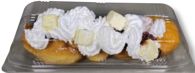
フードパック容器 1本用 〈ユニコンHD-大:透明〉