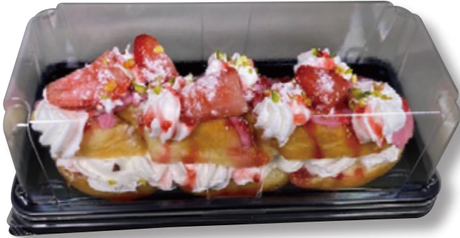
セパレート容器 1本用 〈エスコンKD35:B〉

商品名：エスコン KD35/ AP_FKD85【蓋】 外 寸：210×100×13 / 205×94×54 内 寸：196×84 本体色：W/B / 蓋：透明 袋入数：50 枚 / ケース：1000 枚 材 質：本体 PS / 蓋 A-PET