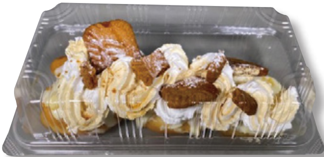
フードパック容器 1本用 〈ユニコンLS-23(大):透明〉

商品名：ユニコン LS-23(大) 外 寸：198×113×36 (蓋高:30) 内 寸：181×95 本体色：透明 袋入数：100 枚 / ケース：900 枚 材 質：OPS