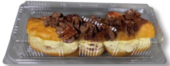
フードパック容器 1本用 〈ユニコンLS-20:透明〉

商品名：ユニコン LS-20 外 寸：239×107×30 (蓋高:30) 内 寸：216×84 本体色：透明 袋入数：100 枚 / ケース：600 枚 材 質：OPS