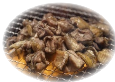
宮崎県 みやざき地頭鶏