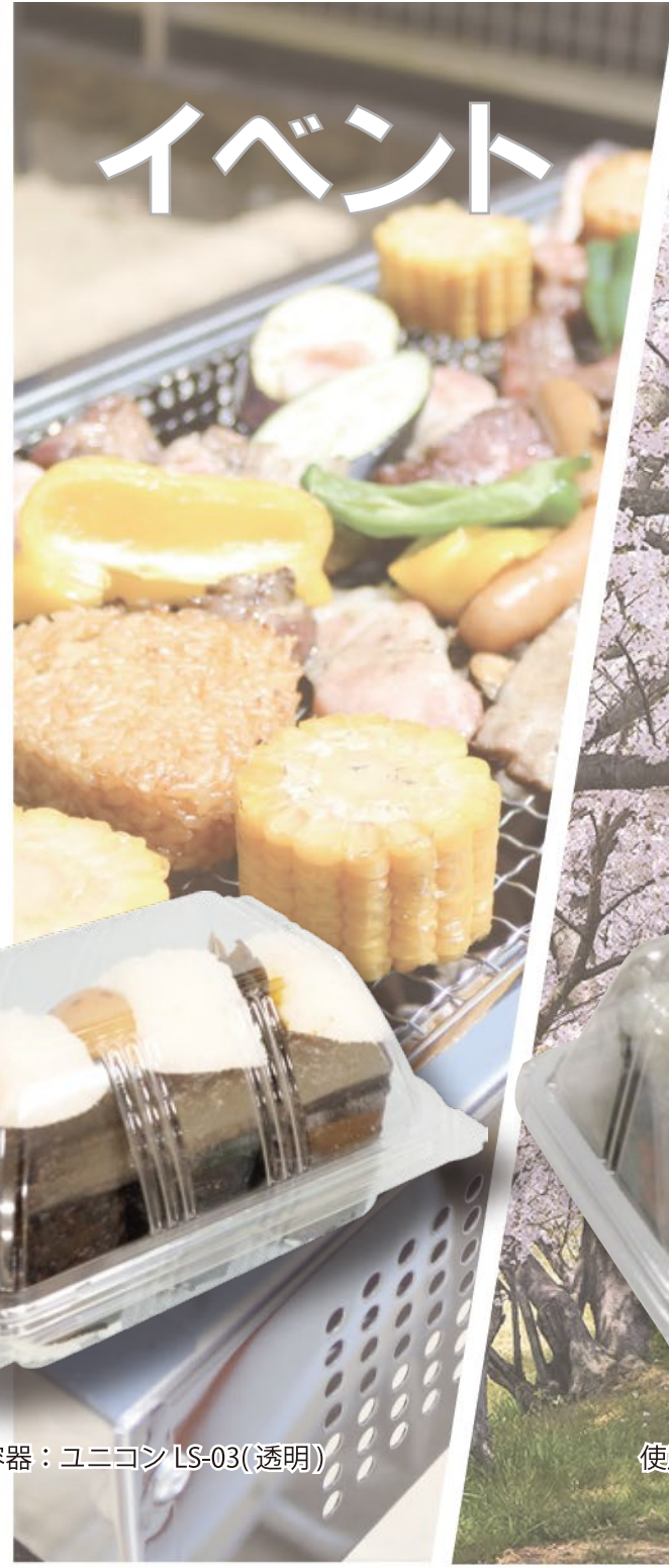
使用容器：ユニコン LS-03(透明)