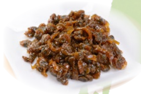
島根県 しじみの佃煮