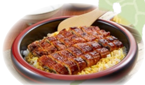
愛知県 ひつまぶし