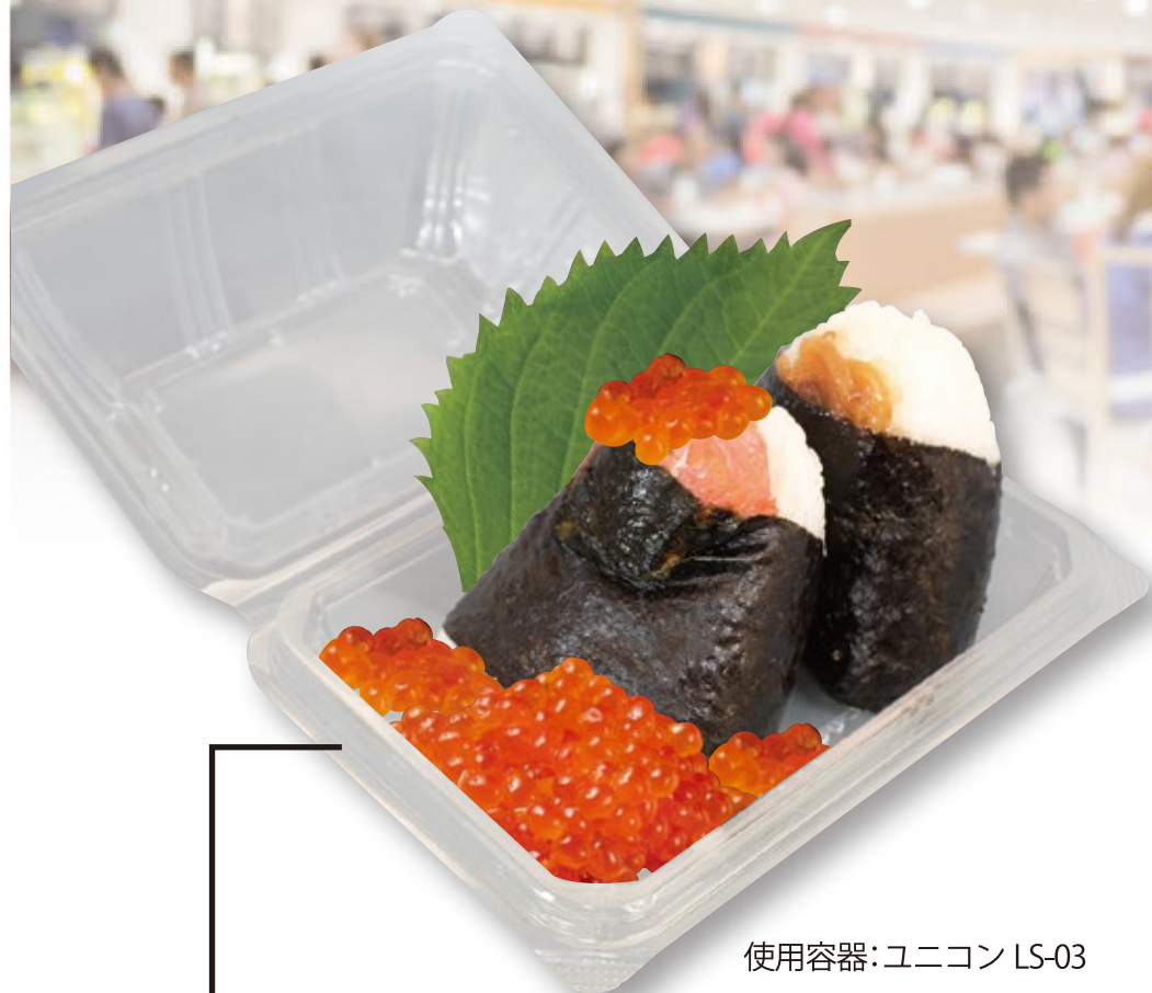
使用容器:ユニコン LS-03

容器のなかいっぱい具材を詰めて 「具沢山」のインパクトでお客様の購買意欲を刺激します！