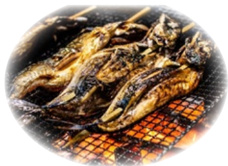
福井県 浜焼きサバ