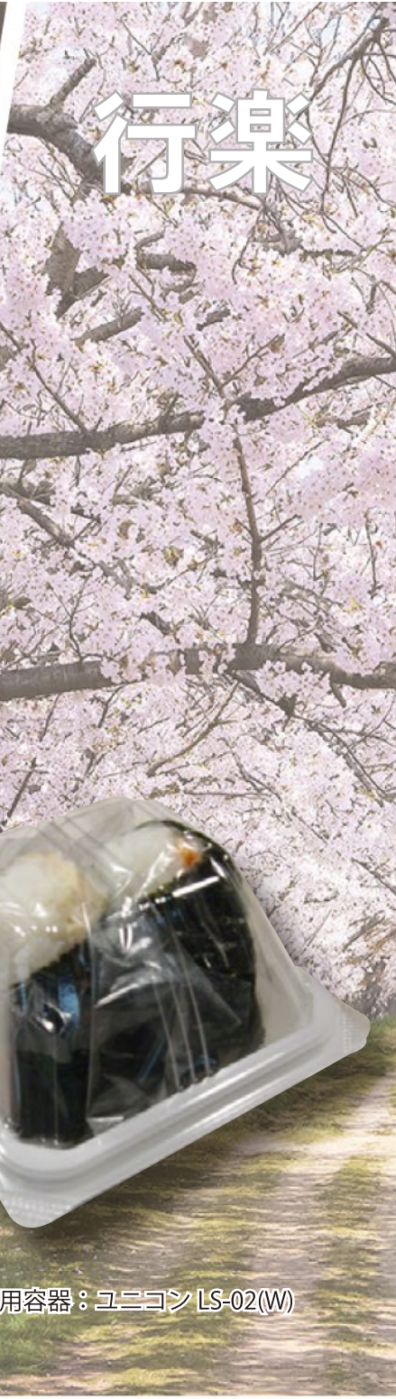
使用容器：ユニコン LS-02(W)