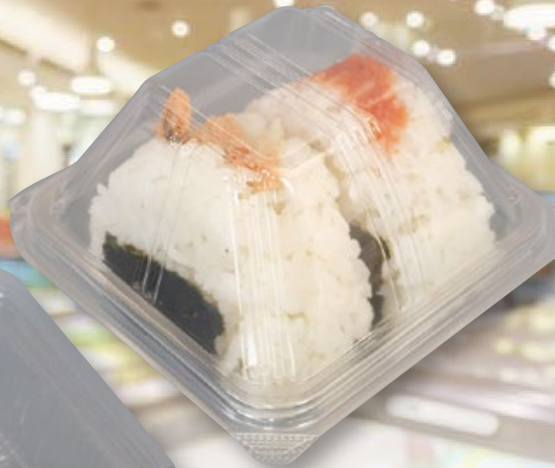
使用容器:ユニコン LS-02