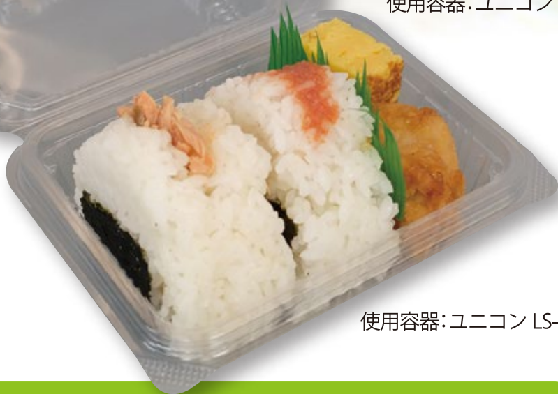
使用容器:ユニコン LS-28

汎用性のある、おにぎりセット容器 からあげや玉子焼きなど惣菜セットに丁度いいサイズ感！