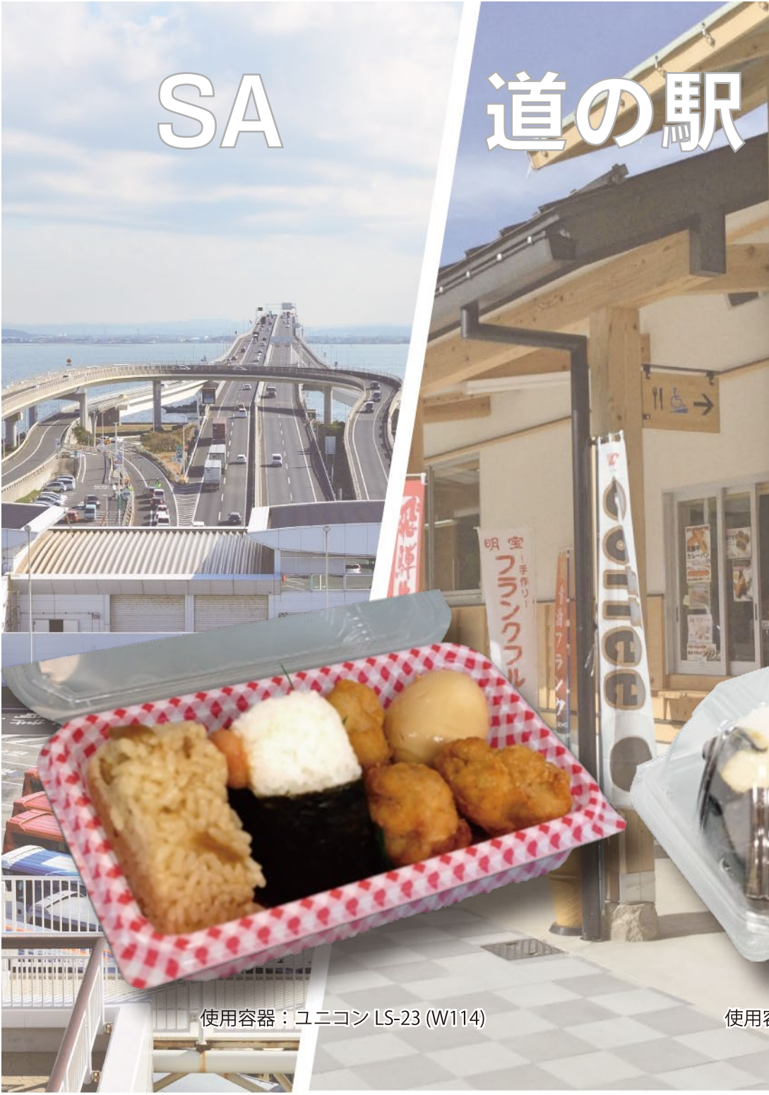
使用容器：ユニコン LS-23 (W114)