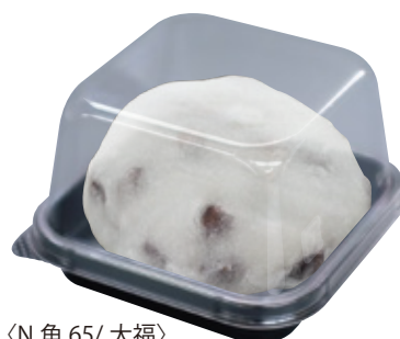
〈N 角 65/ 大福〉