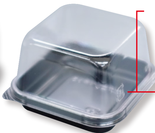
エスコン N 角 65