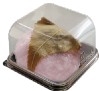
〈N 角 60/ 桜餅〉