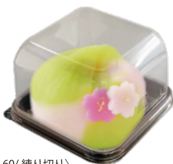
〈N 角 60/ 練り切り〉