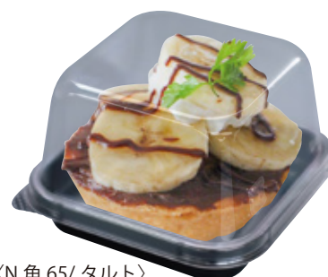
〈N 角 65/ タルト〉