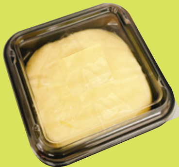
採用例：SP レンジK角 83(B)