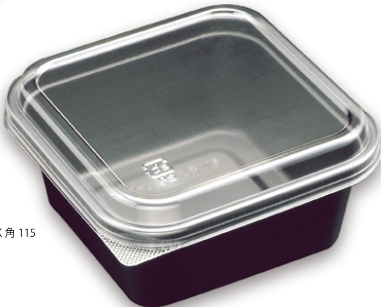
商品名：SP レンジ K 角 115 内容量：380 cc