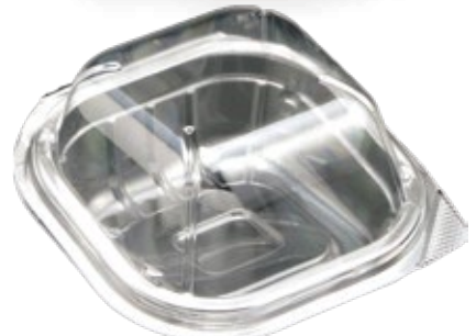
商品名：ユニコンLS-角115 ドーム 外 寸：110×111×27(蓋高：36) 内 寸：91×91×27(蓋高：36) 色 柄：透明 袋入数：100枚 ケース 1500枚