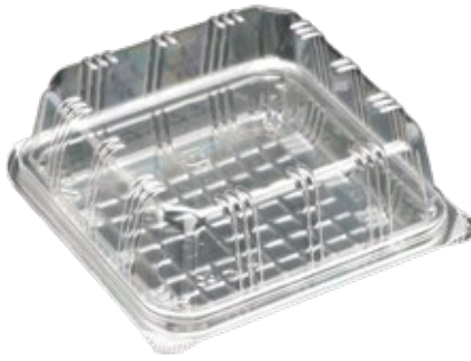
商品名：ユニコン LS-T9 外 寸：126×127×18(蓋高：32) 内 寸：110×110×18(蓋高：32) 色 柄：W・W114・W525・透明 袋入数：100 枚 ケース 1000 枚