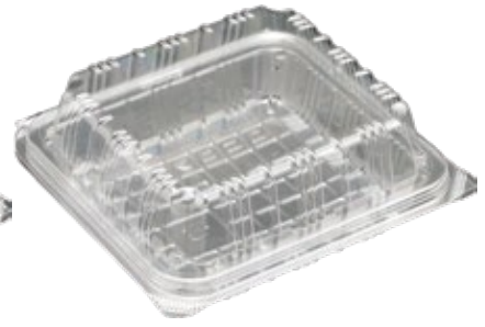
商品名：ユニコン LS-角3(盛) 外 寸：141×136×26(蓋高：25) 内 寸：121×115×26(蓋高：25) 色 柄：W・透明 袋入数：50 枚 ケース 800 枚