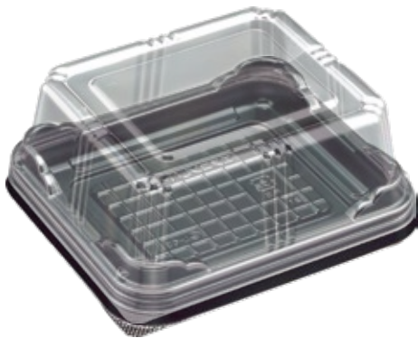
〈本体〉 商品名：エスコ LN-55 サイズ：126×146×13 色 柄：W・B・W525 内柄 袋入数：100 枚 / ケース 1200 枚