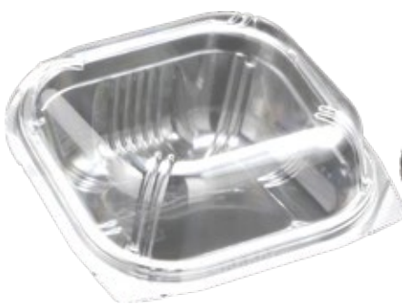
商品名：ユニコンST-角130 ドーム 外 寸：130×130×50(蓋高：13) 内 寸：110×110×50(蓋高：13) 色 柄：B・プラン・透明・ゴールド(新色) 袋入数：50枚 ケース 800枚