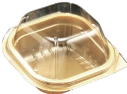
商品名：ユニコンLS-角115-W3 外 寸：110×111×31(蓋高：36) 内 寸：91×91×31(蓋高：36) 色 柄：ゴールド 袋入数：100枚 ケース 1200枚