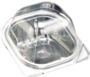
商品名：ユニコンLS-角105 ドーム 外 寸：101×104×36(蓋高：33) 内 寸：83×86×36(蓋高：33) 色 柄：透明 袋入数：50枚 ケース：1500枚