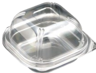
商品名：ユニコンLS-角110 ドーム 外 寸：111×111×30(蓋高：37) 内 寸：90×90×30(蓋高：37) 色 柄：W・透明 袋入数：100枚 ケース 1200枚