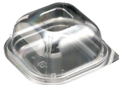
商品名：ユニコンLS-角120 ドーム2 外 寸：122×122×20(蓋高：43) 内 寸：101×101×20(蓋高：43) 色 柄：透明 袋入数：100枚 ケース 1000枚