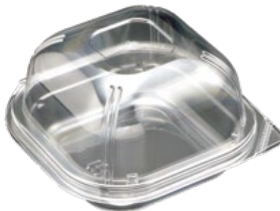
商品名：ユニコンLS-角120 ドーム 外 寸：122×122×30(蓋高：43) 内 寸：101×101×30(蓋高：43) 色 柄：W・B・透明・ゴールド(新色) 袋入数：100枚 ケース 1000枚