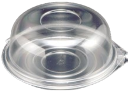
商品名：ユニコン 150 ドーム 外 寸：152×152×18(蓋高：48) 内 寸：134×134×18(蓋高：48) 色 柄：透明 袋入数：100 枚 ケース 600 枚