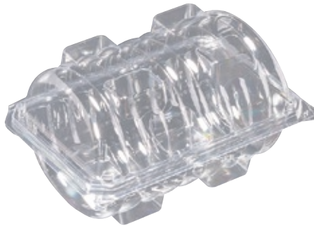
商品名：ユニコン Round-S 外 寸：188×129×58(蓋高：48) 内 寸：168×109×58(蓋高：48) 色 柄：透明 袋入数：50 枚 ケース 400 枚