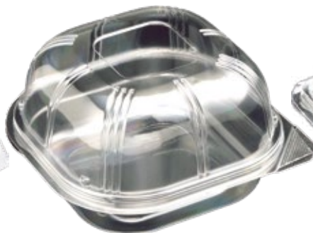
商品名：ユニコンLS-角135 ドーム 外 寸：136×137×35(蓋高：43) 内 寸：119×119×35(蓋高：43) 色 柄：透明 袋入数：100枚 ケース：800枚