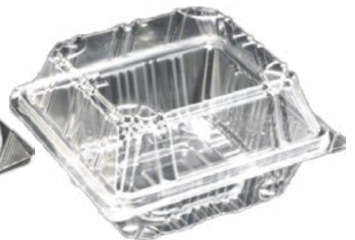
商品名：ユニコンDN-135 外 寸：138×135×45(蓋高：32) 内 寸：120×116×45(蓋高：32) 色 柄：透明 袋入数：100枚 ケース 1000枚