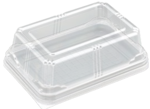
〈本体〉 商品名：エスコ LN-C サイズ：127×185×13 色 柄：W・B・W525 内柄 袋入数：100 枚 / ケース 1500 枚