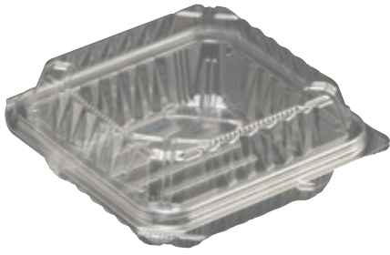
商品名：ユニコン LS-T7 外 寸：126×127×31(蓋高：20) 内 寸：109×109×31(蓋高：20) 色 柄：透明 袋入数：100 枚 ケース 1000 枚