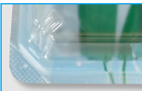
②作業時に指を傷つけないローレット加工